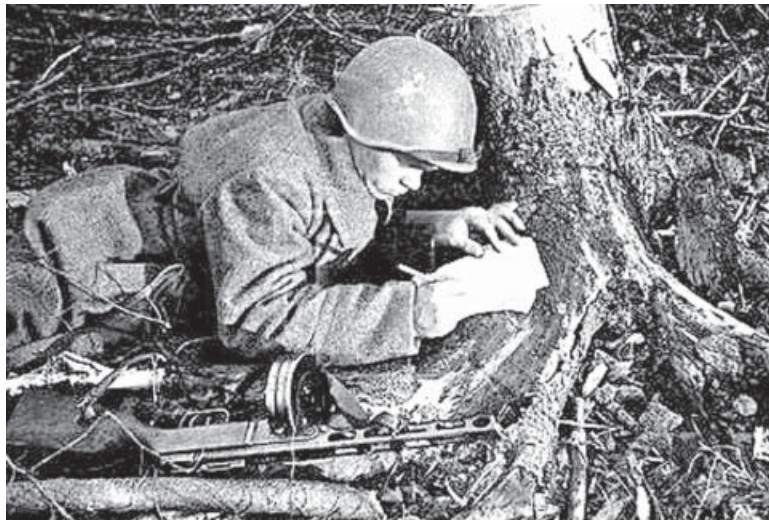
Так нередко писали бойцы письма с фронта.